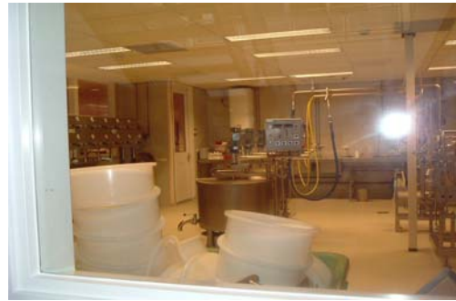
Op bezoek bij DSM