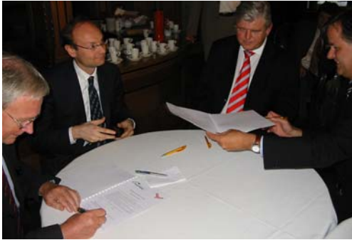
De ondertekening van het convenant

Vuurtorenwachtters kennisvangnet 2005 uit: