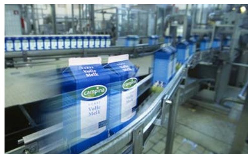
Food and the Factory