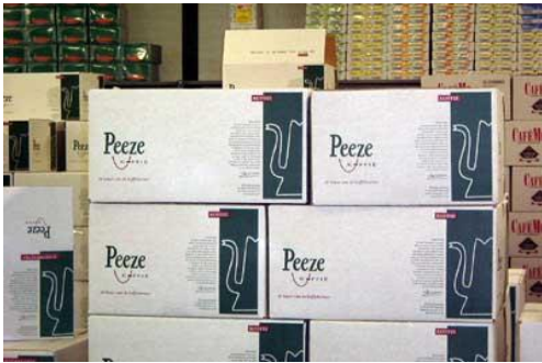
Verpakte koffie in het magazijn van Peeze

decontaminatie van voedingsmiddelen aanbiedt. Bovendien trad de Stichting Food Valley zelf als gastheer op tijdens de kerstbijeenkomst van het Business Café in Hotel de Wereld. Eén keer per jaar organiseert de Stichting Food Valley tevens een gezamenlijk bezoek aan een interessante beurs in Europa; in 2005 was dat de Anuga in Keulen.