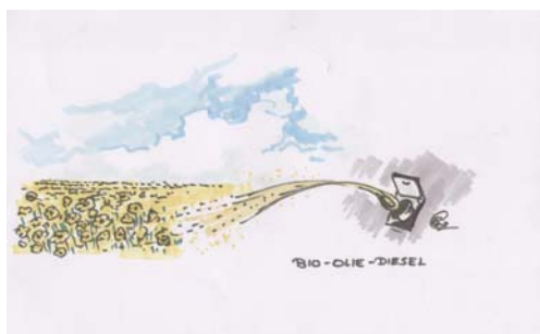
Biobased business: een mogelijke toepassing ...

Een 'ruraal park' waar de consument zijn verse voedselproducten direct bij de producent uit de regio koopt. Nederland heeft naar verwachting ruimte voor een stuk of vijf van dit soort parken. Douanekeuringen verplaatsen van de havens naar productielocaties in het achterland, Barneveld bijvoorbeeld. En kaasproducenten die hun transporten naar afnemers in het buitenland willen combineren. Het zijn slechts enkele van de vele ideeën die ondernemers en onderzoekers presenteerden tijdens de workshop Food Valley Logistics. Circa honderd belangstellende ondernemers bezochten de workshop, voornamelijk afkomstig uit transport en logistiek. De workshop was een initiatief van Oost NV, die samen met de Stichting Food Valley bedrijven en kennisinstellingen en bedrijven uit de food sector bij elkaar wilde brengen. Doel: meer kennisintensieve bedrijvigheid. Slimmer omgaan met transport en logistiek is onderdeel van veel van de ideeën die inmiddels vanuit het programma worden ondersteund.