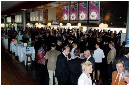
Netwerken tijdens de Conferentie

Een nieuw element was de zogenoemde ´Innovatieproeverij´, waarbij innovatieve bedrijven gedurende de middag lieten zien hoe zij met de toekomst van de food bezig zijn. Door de gehele opzet van de proeverij werden contacten met deze en andere bedrijven snel gelegd.