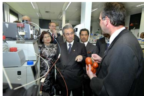
De premier van Maleisië bij Plant Research International