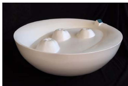
Het kunstwerk van Olav Slingerland